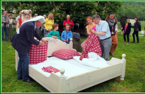
Eröffnung 2015 in der Wetzelmühle, Rothschönberg